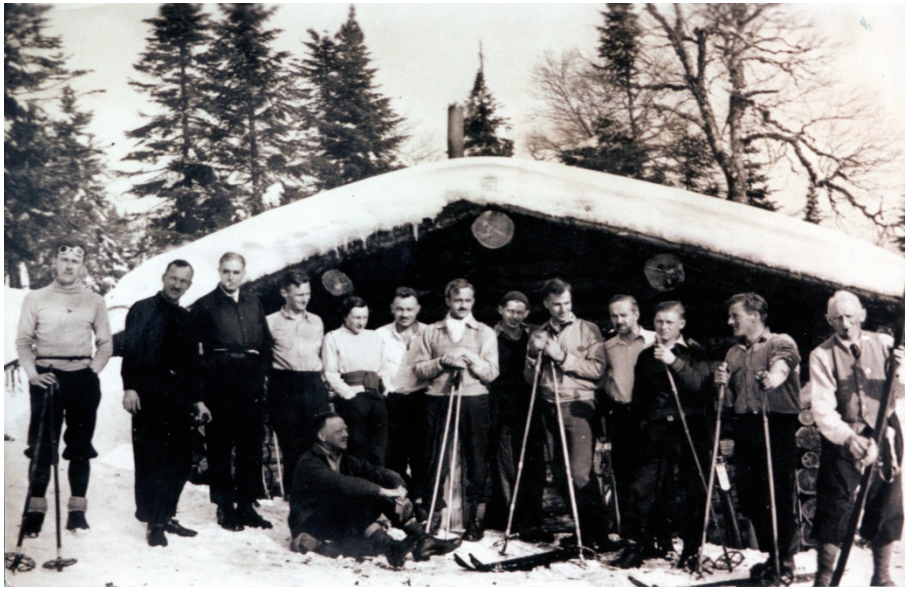
Red Bird Ski Club, Musée du ski des Laurentides – Laurentian Ski Museum